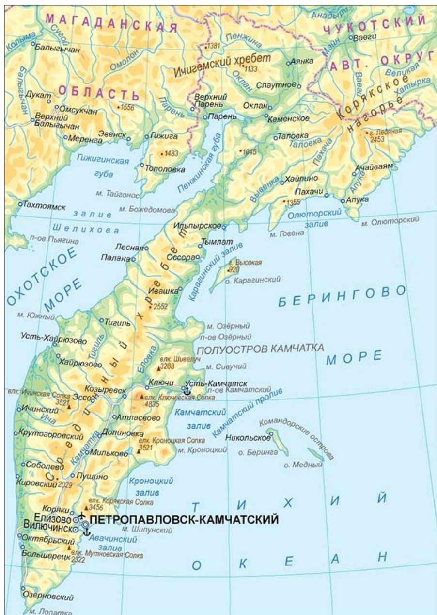
Камчатский полуостров на карте России