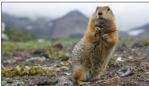
Берингийский суслик (евражка)

Камчатка привлекает туристов со всего мира своими уникальными природными достопримечательностями. Долина гейзеров – одно из крупнейших гейзерных полей мира – природная зона на территории Кроноцкого заповедника, с выходящими из-под земли термальными источниками. Это удивительное место было открыто в начале 40-х гг. XX века экспедицией советских ученых. В ущелье, по которому бежит река Гейзерная, выходят на поверхность двадцать крупных гейзеров, и несколько сотен небольших ключей. Долина постоянно дымится, и загадочные струйки дыма окутывают окрестности.