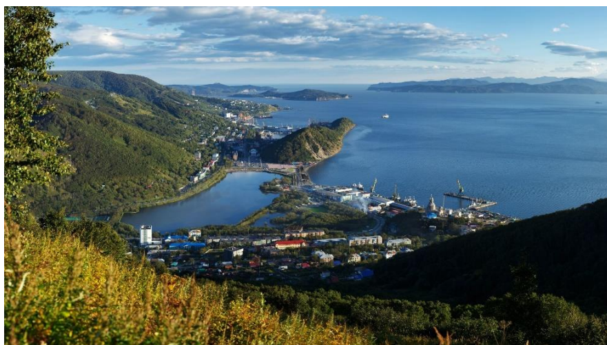
Петропавловск-Камчатский. Вид на Авачинскую бухту

Главной достопримечательностью Петропавловск наградили сама природа. Над живописной Авачинской бухтой возвышаются Корякская, Вилуйская и Авачинская сопка. Сюда несут свои воды реки Паратунка и Авача. А вход в бухту, подобно былинным братьям, защищают утесы под названием «Три брата».