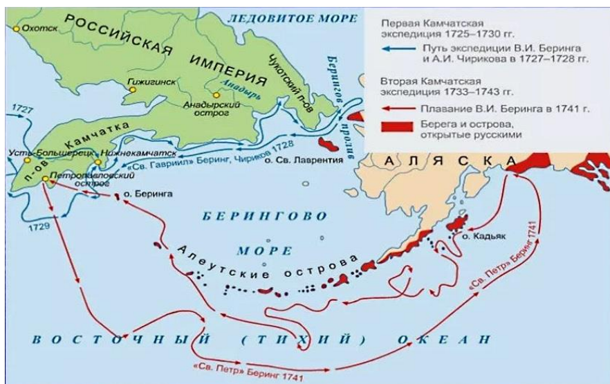
Маршруты Первой и Второй Камчатских экспедиций

В 1742 году Шпанберг в третий раз отправился на исследование Курил — теперь в этом ему помогали два переводчика-айна, однако из-за неблагоприятной погоды экспедиция вскоре вернулась обратно в Охотск. Итогом русских Тихоокеанских экспедиций стало открытие пути от Камчатки в Японию, всех островов Курильской гряды и части островов северной Японии.