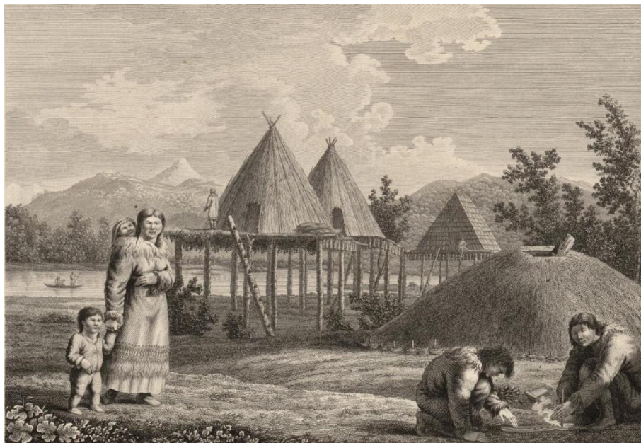
Поселение камчадалов (старинная гравюра)

искрами. Рассказывал про воняющие тухлыми яйцами источники (богатые сероводородом), поляны необычных ягод, размером с куриное яйцо, высокую по пояс сладкую траву «агатку». Также упоминал об изобилии пушного зверя и богатых рыбой реках.