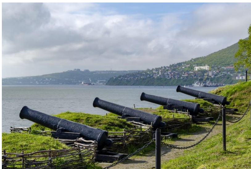
Батарея Максимова (Никольская сопка)

Сегодня Петропавловск-Камчатский – крупный промышленный и культурный центр Дальнего Востока с населением свыше 160 тысяч человек. С остальными регионами России город сообщается водным и воздушным транспортом. В Петропавловске работают музеи, театры, выставочные центры. Например, экспозиции музея «Вулканариум» рассказывают о главном природном достоянии края – гейзерах и вулканах. Рядом с историческим центром есть природный парк Никольская сопка, а познакомиться с историей и бытом коренных народов Камчатки можно в этнодеревне Танынаут, расположенной на берегу живописного Халактырского озера.