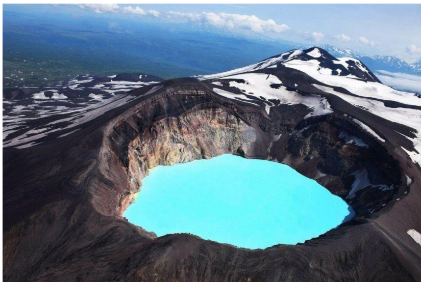
Голубое озеро (вулкан Горелый)

В природном парке «Три вулкана» находится действующий вулкан Горелый . Территория огромного массива площадью 150 кв. км. Он включает многочисленные конусы и кратеры, фумарольные трещины и вулканические озера. Горелым вулкан прозвали за бурую окраску склонов, вызванную регулярными извержениями. Красивейший из его водоемов – овальное Голубое озеро длиной около полукилометра, расположенное в вулканической котловине, в окружении коричневых скал.