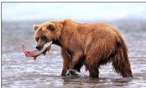
Камчатский бурый медведь