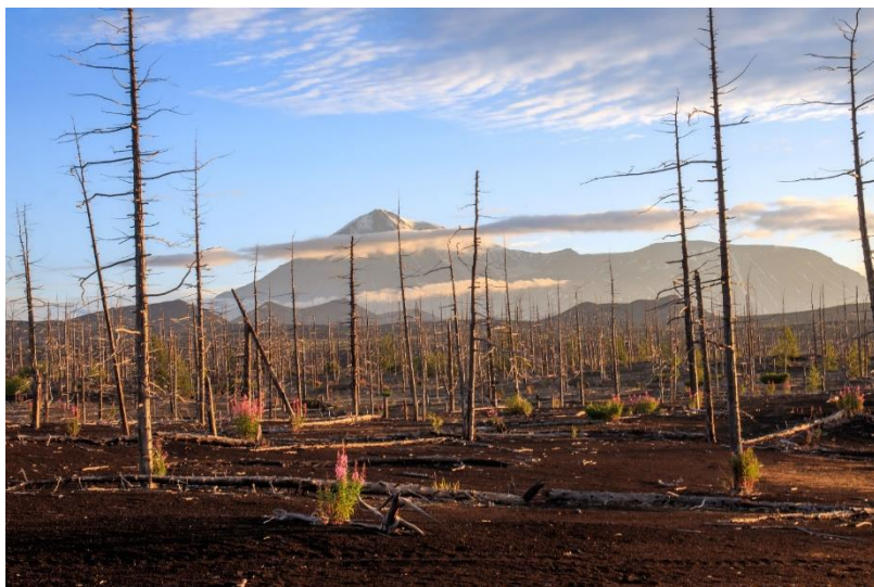
Мертвый лес у вулкана Толбачик

постапокалиптическим сюжетом: безжизненная земля, голые обугленные стволы деревьев, гнетущая тишина. До извержения Толбачика в 1975 году здесь был лес, в котором кипела жизнь. Но за считанные часы он превратился в мёртвый: большую часть леса уничтожили потоки лавы, а остальное покрылось толстым слоем пепла и шлака. Суровые виды Мёртвого леса привлекают фотографов со всех уголков страны: в творческих порывах они ищут сюжеты для пейзажных снимков эпического характера.